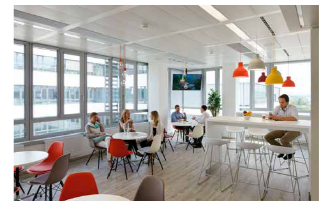
▶ Wesentlich war der Anspruch von GSK die MitarbeiterInnen umfassend einzubinden und den Gestaltungsspielraum des Konzepts an die Change Agents, als VertreterInnen ihrer KollegInnen, weiterzugeben. Die Österreichische Niederlassung gilt im GSK Konzern als Best Practice Beispiel.