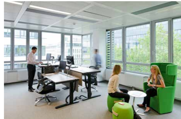
▶ Im Rahmen des SmartWorking -Konzeptes wurde ausgehend von der Vielfalt an Tätigkeiten, die bei GSK ausgeübt werden, eine Varianz an Arbeitsumgebungen geschaffen: Von Open-Space-Lösungen mit Steharbeitsplätzen und Besprechungsmöglichkeiten...