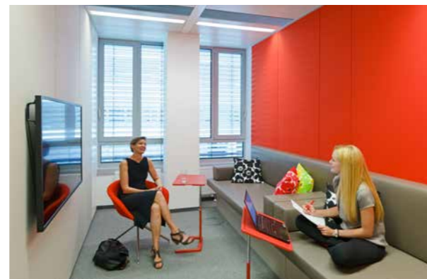
▶ ...oder in denen Besprechungen abgehalten werden können...