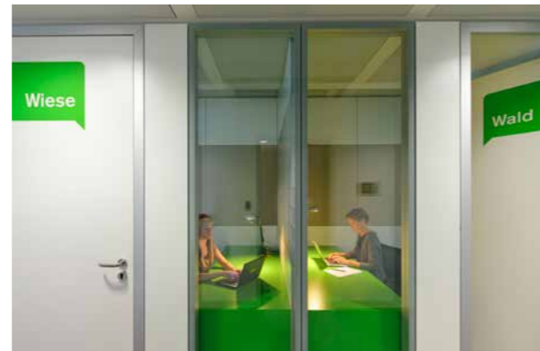
▶ ...über Räume, in denen ungestört gearbeitet oder telefoniert werden kann...