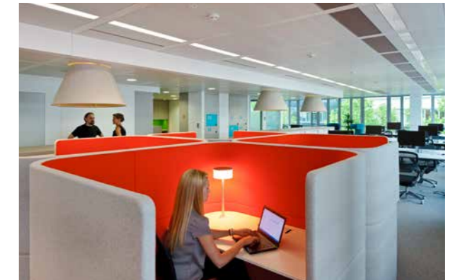
▶ ...bis hin zu schalldämmenden Kojen, für kurze Telefonate oder konzentrierte Einzelarbeit.

Die Wertschätzung der MitarbeiterInnen von GSK Österreich durch das Unternehmen spiegelt sich sowohl im hochwertigen Prozess als auch in der neu geschaffenen, gestalterisch überaus ansprechenden Arbeitsumgebung wieder. Die Österreichische Niederlassung gilt im GSK Konzern als Best Practice Beispiel.