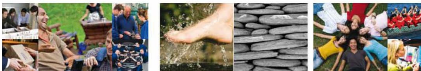
Abbildung 5: Moodboard gugler*