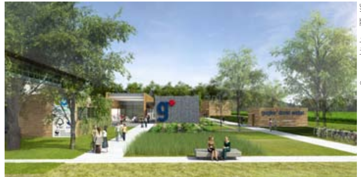
© pos architekten ZT - KG