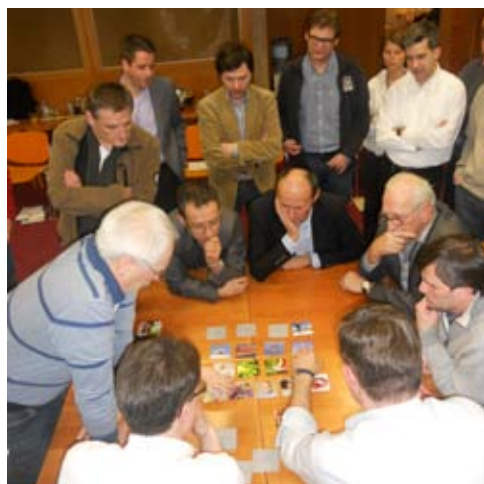
Abbildung 4: Workshops mit M.O.O.CON MOODS

Den zuvor definierten Identitätsmerkmalen werden aus einem Pool von rund 400 Bildern zwischen 40 und 80 Motive zugeordnet. Diese Motive bilden gemeinsam mit der ihnen zugrunde liegenden Wortwelt von 10-20 Begriffen ein unternehmensspezifisches Set an Basismaterial für das zu erarbeitende Moodboard. In einem Workshop mit Mitarbeitern und Führungskräften wird schliesslich interaktiv ein Moodboard bestehend aus maximal 25 Wörtern und Bildern erarbeitet. Das Ergebnis ist eine konzentrierte Assemblage von Bildern und Wörtern, die die Identität der Organisation abbildet und auf einen Blick emotional erfassbar macht. Damit erhält der Architekt hervorragendes und verlässliches Material für einen sehr gezielten Gestaltungsprozess.